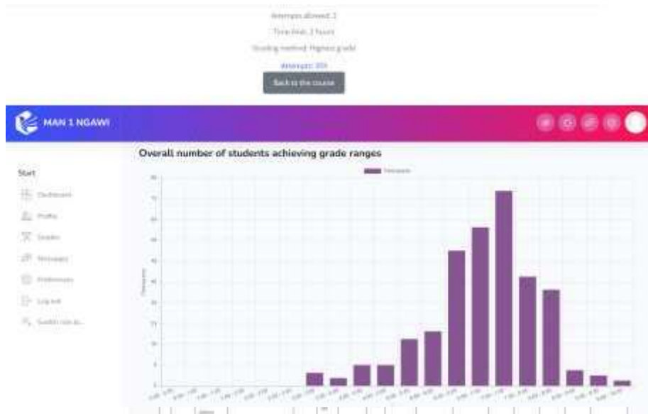
Gambar 4.2. Hasil Ujian Madrasah di Moodle

Dari gambar diatas dapat diketahui hasil asesmen siswa menunjukkan hasil yang baik, tingkat keikutsertaan peserta yang baik serta hasil yang tidak seragam.